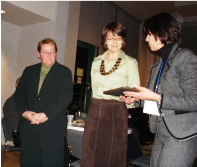
At the opening reception À la réception d'ouverture