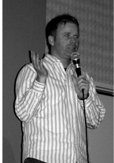
Gerry Dee, comedian / humoriste